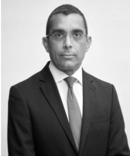
Χρύσης Παντελίδης Βουλευτής Λευκωσίας του Δημοκρατικού Κόμματος