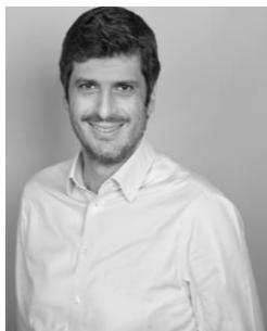
Δημήτρης Δημητρίου Βουλευτής Λευκωσίας, ΔΗΣΥ Εκπρόσωπος Τύπου ΔΗΣΥ